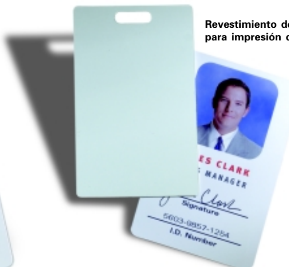
Revestimiento de PVC para impresión directa