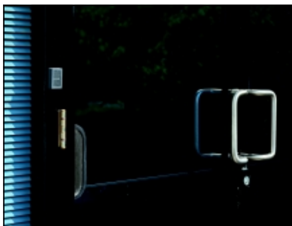
Se muestra la unidad de antena removible en un montaje separado de la unidad de control.