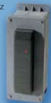
La versión de Ubicaciones Peligrosas integra una caja de instalación normalizada para este fin.