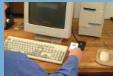
Autenticación segura en PC con la pcProx.